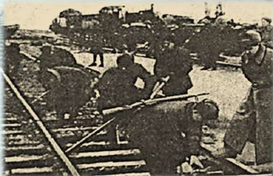
АДЛС Ф.Р. - 821.Оп.1л. Д.1.Л.1,10

Нач. "Связьрем" А 18 Исполн. нач. охраны А. Козу